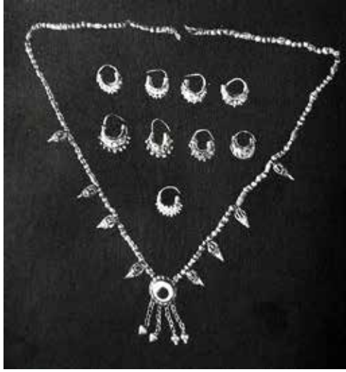
Նկ. 4. Վզնց, ոսկի, Ք.ա. VII դ., Զիվիև: Stén Ghirshman R., Iran: Protoiranier, Meder, Achämeniden. München: C. H. Beck, 1964, p. 115.

րիթ, Հնդկաստան, Չինաստան, Ճապոնիա, Մեքսիկա), որոնց մեծ մասի տնտեսությունը հիմնված էր արհեստական ռոռզման վրա (այսպես կոչված իռիզացիոն կամ հիդրավիկ հասարակություններում), դրա շնորհիվ հատուկ նշանակություն էր ստանում ավելի վաղ շրջանից ժառանգված ջրամբարների պաշտամունքը՝ կապված վիշապի հետ: ...Վիշապի կապը բերքի, պտղաբերության հետ կրկին իմաստավորվում էր այնպես, որ վիշապը հանդես էր գալիս որպես դրական սկզբի մարմնավորում՝ որպես այնպիսի օգնական, որը մարդկանց ջուր է տալիս և հարստություն» 1 : Իսկ տգրուկներ միայն բժշկության մեջ էին օգտագործում հայերը: Վիշապի գաղափարը Հայաստանում տարածված է ժողովրդական հավատալիքներում և, ինչպես նշվեց, դեկորատիվ արվեստի որոշակի ճյուղերում, այն, առհասարակ, բնորոշ է հայկական մշակույթին: Վիշապները հավատալիքներում տարբեր կերպարանքներով ու գործառույթներով են հանդես գալիս: Ինչ վերաբերում է երկզվիսանի վիշապներով վզնոցների վաղեմությանը, կրկին անդրադառնանք Ք.ա. VII դարի Զիվիեյում (վայր Ուրարտական թագավորությունում. նաև Զիվան կամ Զուանի՝ հավանաբար Մաննա երկրամասում: Հիշատակվում է ուրարտական արձանագրություններում 2 ) դամբարանից հայտնաբերված նմուշին, որի վիշապները ոչ թե