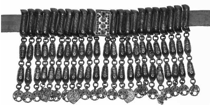
Նկ. 2. Վզնոց (ՀՊԹ, N 4577), արծաթ, XIX դ., Շատախ/Թաղ, Վանի գավառ, Վանի նահանգ: