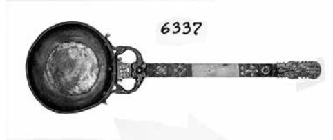
Նկ. 6. Սափոր (ՀՊԹ, N 2378), պղինձ, XVIII դ., ք. Կարին: