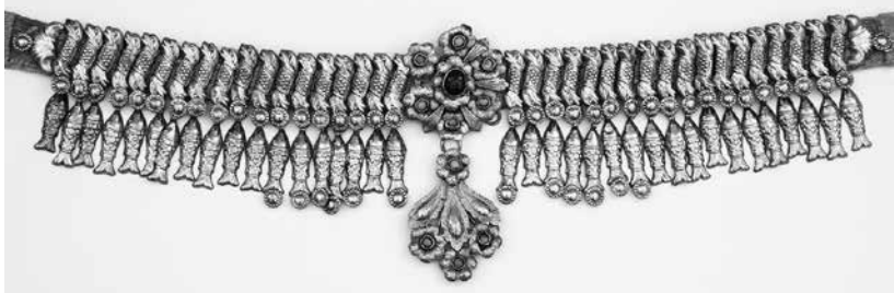
Նկ. 3. Վզնոց (ՀՊԹ, N 5001), արծաթ, XVIII դ., ք. Կարին:

Կարսում, Ալեքսանդրապոլում, Ախալքալաքում, Ախալցխայում, Թիֆլիսում, Բայազետում, Սասունում, Մուշում, Շատախում, Արճեշում, Թիմարում, Զիլանում, Դիարբեքիրում, Վանում: Վզնոցների ընդհանուր կառուցվածքը ամենուր նույնն է, սակայն կատարման նրբությունների որոշակի տարբերություններ ունեն և, որպես կանոն, կազմված են երեք կամ չորս շարքից: Վիշապները գրավում են առաջին՝ վերևի շարքը, պատրաստված են ձուլման եղանակով և ունեն ուղղահայաց դիրք: Նրանք երկու տեսակի են. առաջինը՝ երկգլխանի վիշապներն են, գլուխները վերևում և ներքևում հակառակ կողմեր են նայում, իրանին ուռուցիկ գծանախ-