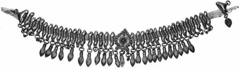
Նկ. 1. Վզնոց (ՀՊԹ, N 5009), արծաթ, XIX դ., Վանի գավառ, Վանի նահանգ: