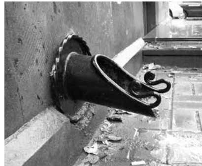
Նկ. 8. Ջրհորդաններ, XIX դ. սկիզբ, ք. Ախալցխա: