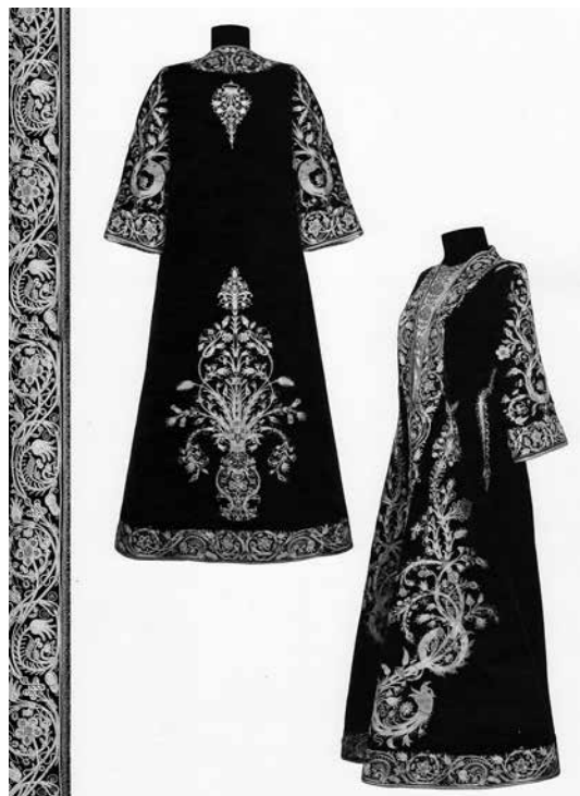
Նկ. 5. Զգեստ (ՀՊԹ, N 1679), թավիշ, մետաքս, ոսկեթել, 1850-ական թթ., ք. Ախալցխա: Տեն Հայկական տարագ, XVIII-XIX դդ., Ալբոմ-կատալոգ, Երևան, Հայաստանի պատմության թանգարան, 2014, էջ 21:

նման են, այլ ճիշտ և ճիշտ, առանց որևէ տարբերության, ունեն 18–20-րդ դդ. վիշապների ձևը՝ երկու հակառակ կողմեր նայող գլուխներով, իրանին ուռուցիկ գծիկներով, սակայն սրանց միջև վերադիր հատիկներով ուլունքներ են շարված, որոնց մասին Ռոման Գիրշմանը գրում է, թե հատիկազարդումը բնորոշ է ուրարտական ոսկերչական արվեստին (լուս. 4) 3 :